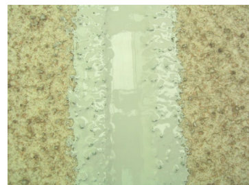
快速シーラー充填