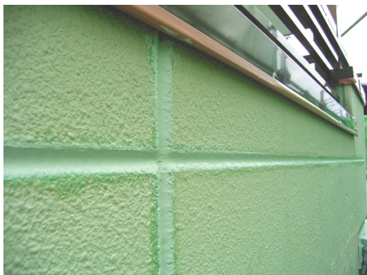
快速シーラー充填